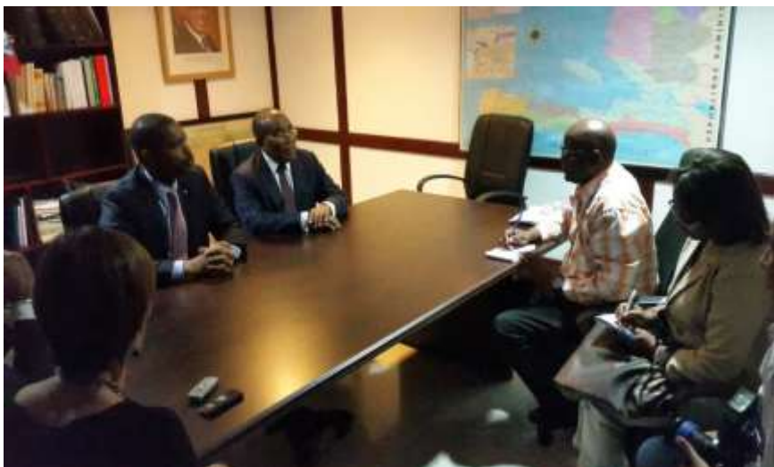
Rencontre avec la Presse Dominicaine à l'Ambassade d'Haiti

rumeurs faisaient croire que le PIDIH serait subventionné par certains bailleurs de fonds. Le Ministre en a profité pour clarifier les faits et rassurer les compatriotes que le Programme d'Identification et de